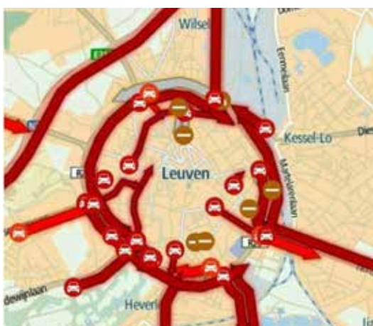
Leuven by Night op vrijdag 25 november 2016 en alles stond stil

De absolute verkeerschaos van ‘Black Friday’ in november zal iedereen nog voor de geest staan. Meer dan één uur om een kilometer of twee af te leggen op de Ring was geen uitzondering (zie kaartje). Een plan invoeren om alle verkeer om te leiden naar de Ring maar geen studie of tellingen uitvoeren om te zien of zo iets kan, is een slechte methode.