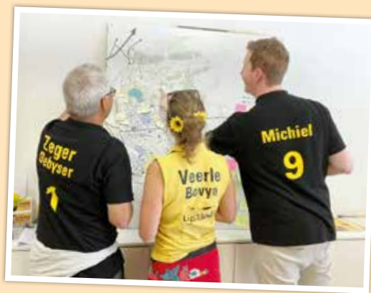
Het circulatieplan van Kessel-Lo bijsturen