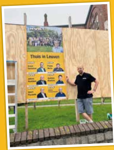
Plakken in Heverlee