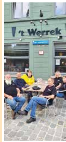
Na het werk in Wijgmaal