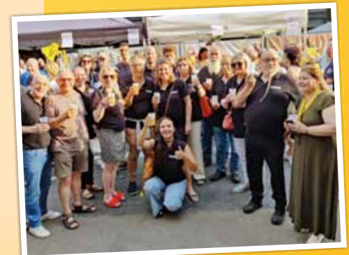
Op de jaarmarkt