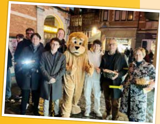
Lichtjes voor de jongeren