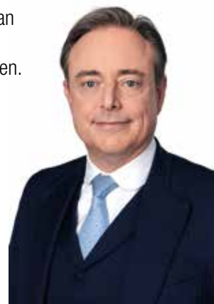
Bart De Wever Algemeen voorzitter