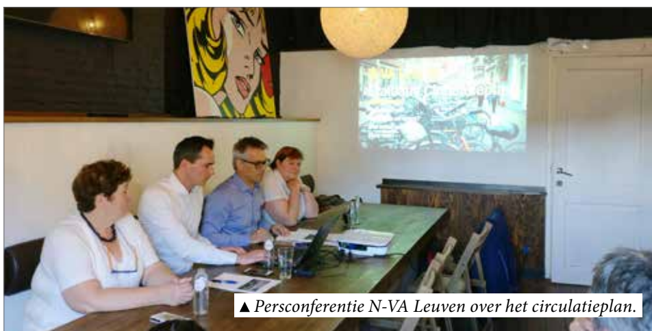
▲ Persconferentie N-VA Leuven over het circulatieplan.

De stad had beloofd om het circulatieplan in maart te evalueren. Nu wordt het juni. Ondertussen worden de lussen onomkeerbaar, de pleinen zijn lelijk ingericht, meer dan 100 parkeerplaatsen gingen verloren en onveilige situaties voor fietsers en voetgangers blijven bestaan. Bovendien kruisen meer dan 1 000 bussen dagelijks het voetgangersgebied. Hoeveel echte inspraak heeft de Leuenaar dan nog?